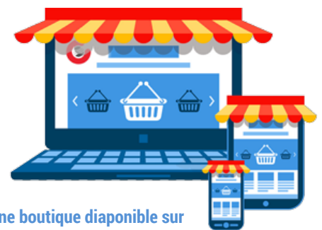
Une boutique disponible sur tous les supports

Le département Webstudio d' Alrix vous accompagne pour mettre en place votre boutique en ligne, clef en main et disponible en quelques jours. La configuration de base inclut la création de quelques articles de vos produits comme exemple et il ne vous restera plus qu'à créer les autres vous-même, et facilement !